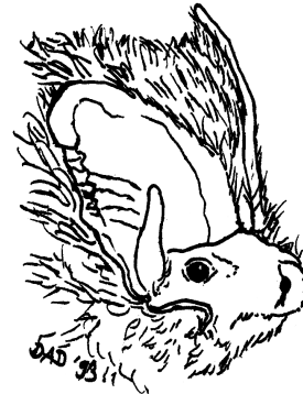
Mopsfledermaus (D. Diehl)

Beschreibung des Tieres: Eine mittelgroße Art mit auffällig geformten Ohren und Tragus, der sich zu drei Viertel deutlich verjüngt und im letzten Viertel parallelseitig lanzettlich verläuft. Das Gesicht ist verkürzt („Mopsgesicht“), die Nasenlöcher sind nach oben ausgerichtet. Das Fell ist oberseits schwarzbraun mit gelblichen oder weißlichen Spitzen, die Bauchseite etwas grauer getönt als die Oberseite. Jungtiere haben weniger helle Haarspitzen. Flughäute, Gesicht und Ohren sind schwärzlich.